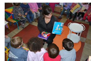
Lecture aux maternelles par Les lycéens