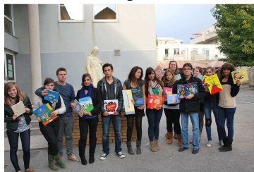
Sortie au Salon du Livre de Troyes