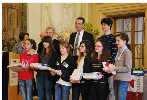
Remise des prix Lauréats Jeanne d'Arc Concours Dis moi 10 mots