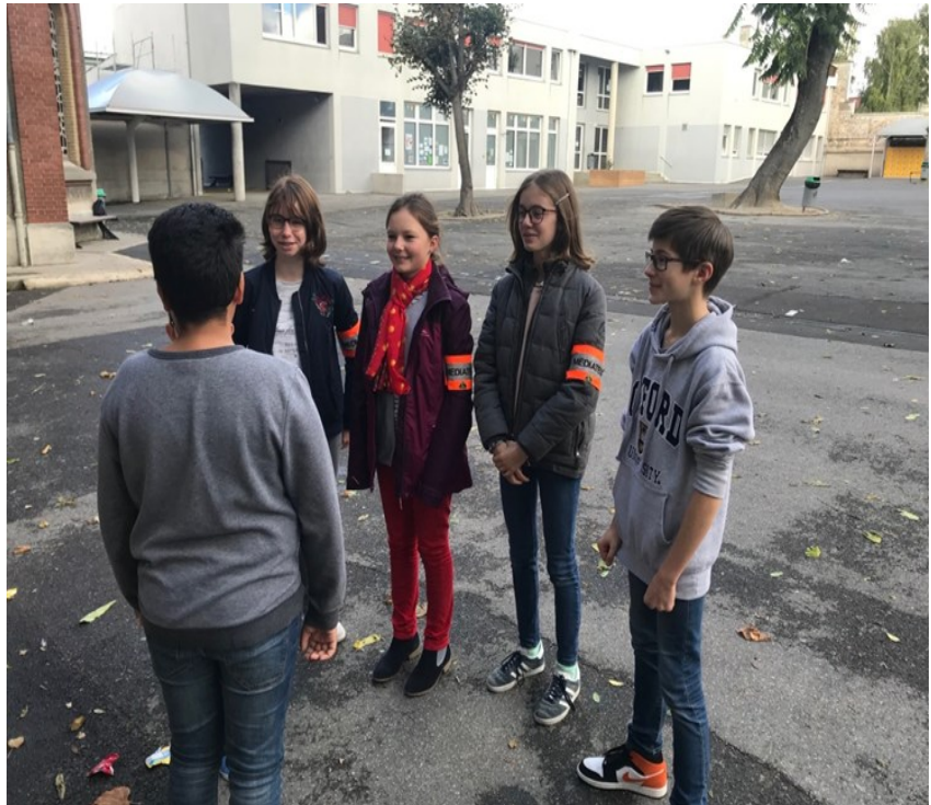
Les médiateurs sont présents dans la cour aux récréations. N'hésitez pas !

Qui intervient si les médiateurs ne trouvent pas de solu-