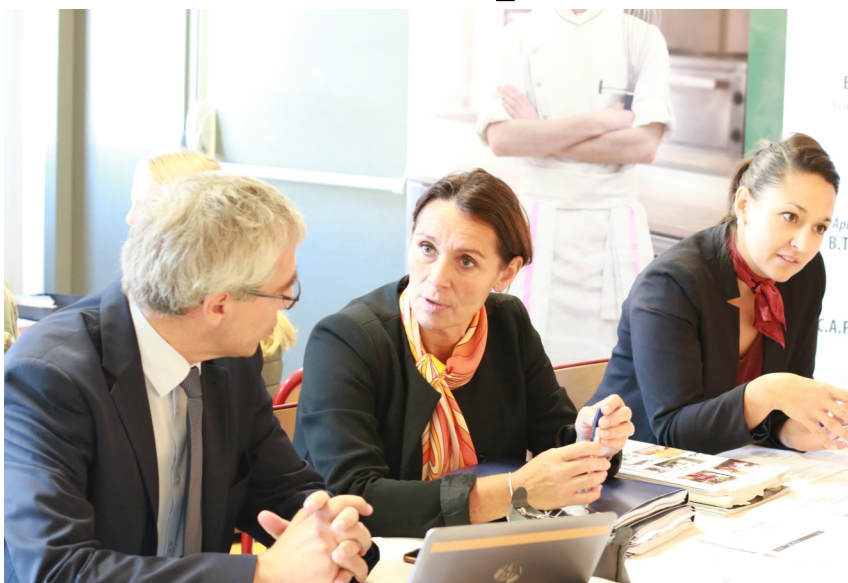
Beaucoup de professions différentes étaient représentées.

B.B. : « Tous les professeurs principaux des 3èmes, le coordinateur du niveau 3e, mais aussi les professeurs du groupe de