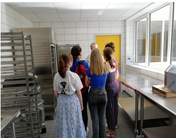
La salle pour cuisiner le froid.

Un dernier tour par une terrasse seulement destinée à la sortie de secours et la visite se termine par un grand merci à M. Tilly !