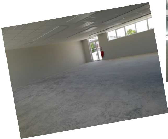
Ci-dessus la salle de sports, à droite en haut la salle des profs et en-dessous la terrasse.