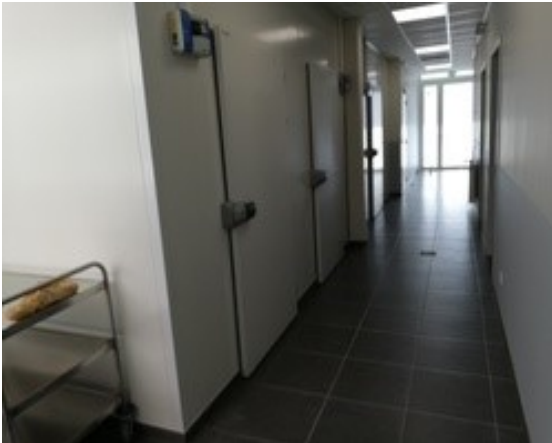
A gauche : l'entrée des cuisiniers et les réfrigérateurs, à droite la salle pour cuisiner le chaud.