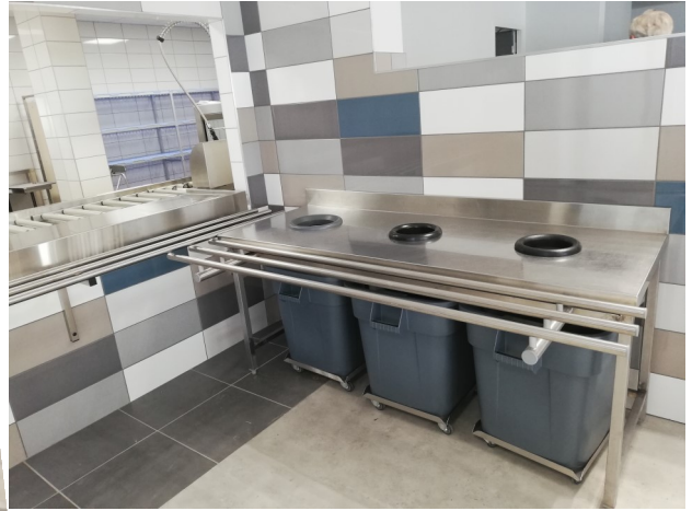
A gauche, M. Tilly montre le cheminement futur des élèves ; à droite passage obligatoire au tri quand on ramène son plateau.