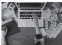
→ Multimédia et web