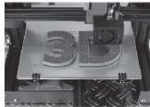
→ Définition de produits