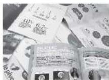
→ Édition et arts graphiques

Les diverses activités liées à la formation sont :