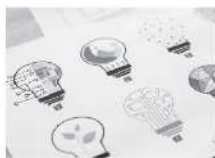
→ Communication visuelle

Le titulaire du Bac. Pro. CVP participe à la production de projets de communication Print et Web depuis le cahier des charges jusqu'à la réalisation finale du support. Au cours de sa formation l'élève va devoir s'intéresser et acquérir des connaissances dans le domaine de la communication visuelle, de l'histoire de l'art et dans le domaine des technologies spécifiques.