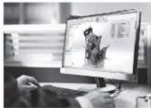
→ Choix de solution