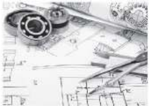
→ Étude et analyse

Le Bac. Pro. EDPI mène à la fonction de technicien de bureau d'étude. La maîtrise des moyens informatiques permet : l'étude et l'analyse de produits, la modification de tout ou d'une partie de produits industriels et la définition de produits. Le technicien utilise des logiciels de calcul et de dessin 3D. Il participe au suivi d'affaires, à l'installation et à la maintenance.